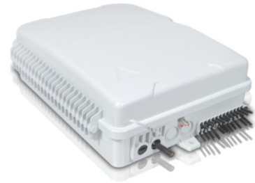
Mod: F2H-FTB-24-A Precio: USD 17,38 – USD 15,01 Fabricante: Shanghai Grandway