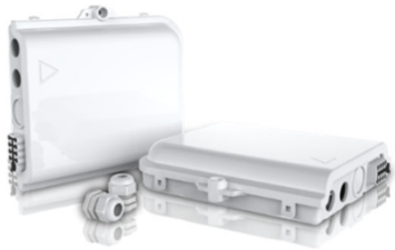
Mod: F2H-FTB-8-D Precio: USD 6,60 – USD 5,70 Fabricante: Shanghai Grandway