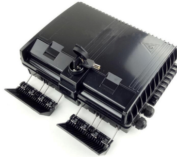
Mod: F2H-FTB-16-A Precio: USD 15,40 – USD 13,30 Fabricante: Shanghai Grandway