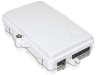
Mod: F2H-FSB-4-A Precio: USD 4,40 – USD 3,80 Fabricante: Shanghai Grandway