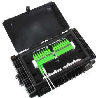
Mod: F2H-FTB-16-H Precio: USD 19,00 Fabricante: Shanghai Grandway