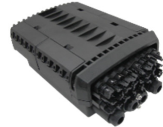
Mod: F2H-JCD-16-I4 Precio: USD 39,00 – USD 32,50 Fabricante: Shanghai Grandway