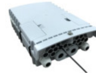
Mod: F2H-FTB-16-L Precio: USD 20,00 Fabricante: Shanghai Grandway